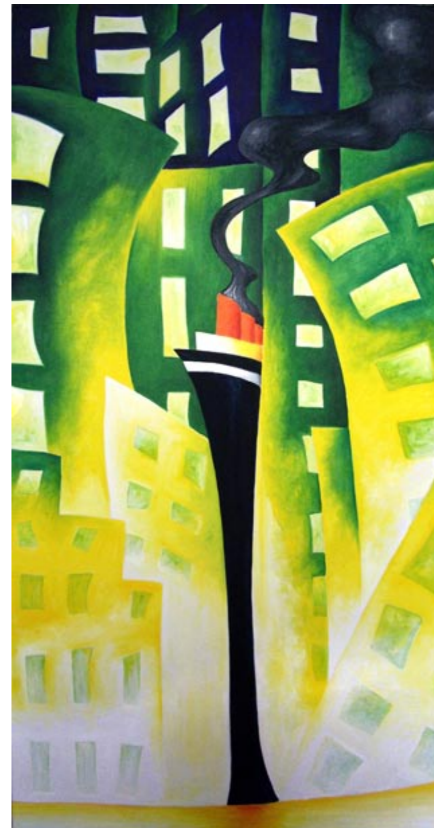
Arrivando a New York Olio su tela 50x100 cm

La città vibra, forse per effetto della metropolitana che la attraversa a pochi metri di profondità, forse per una strana energia che si trasmette da grattacielo a grattacielo, euforica e potente. Quando passeggi per le sue larghe avenue tutto sembra possibile, si respira un clima in cui i sogni ed i progetti sembrano più reali, più realizzabili.