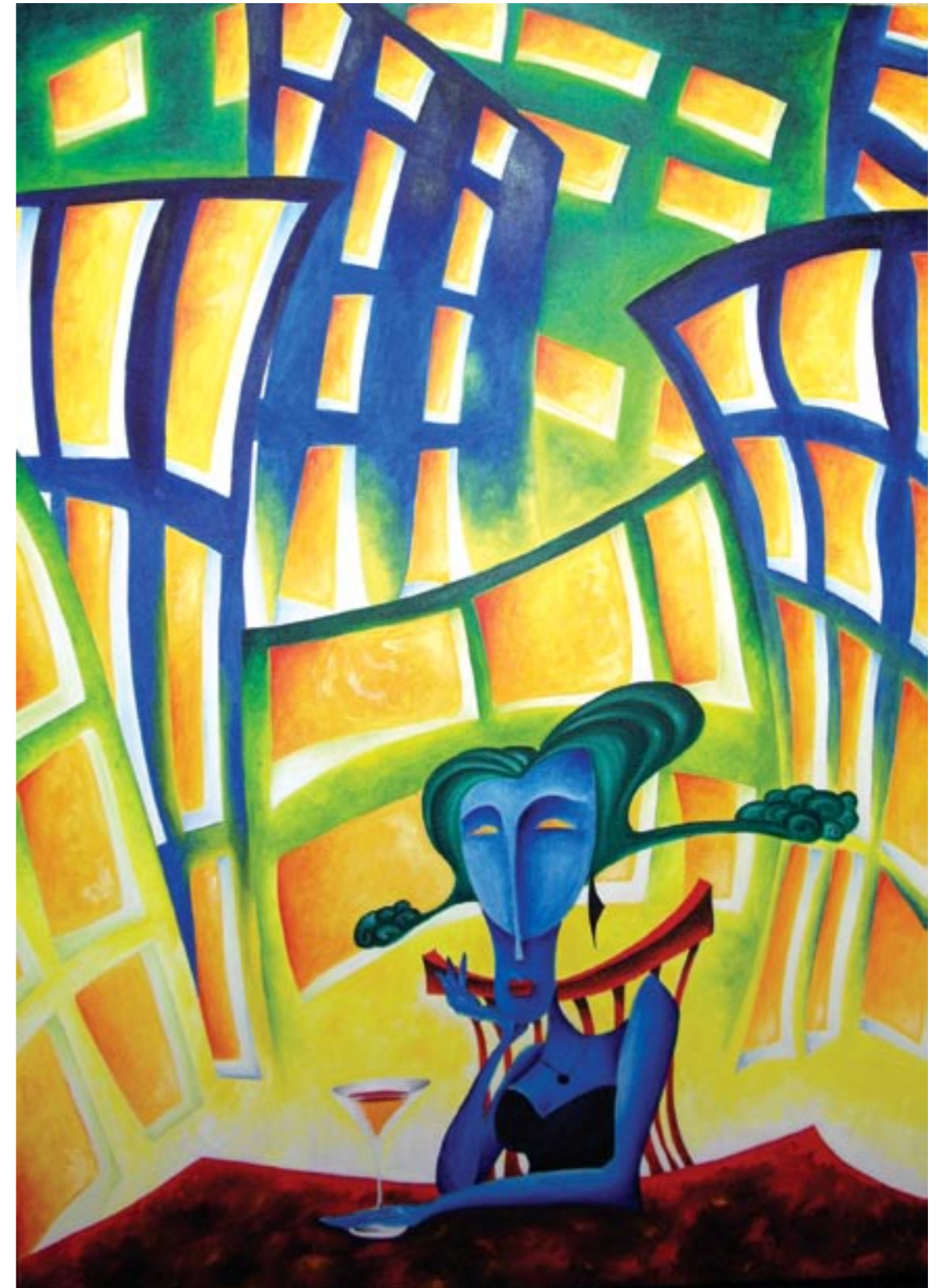
Il Pensiero Ricorrente Olio su tela 70x100 cm