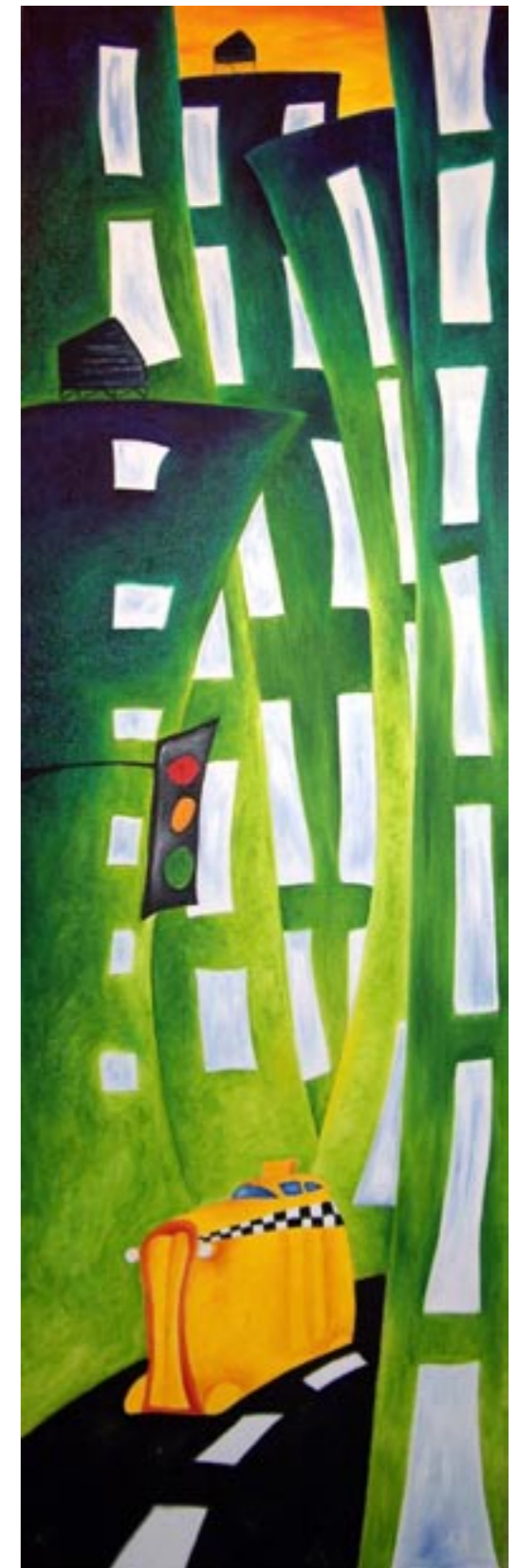
The Yellow Cab olio su tela 30x100 cm